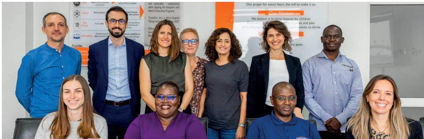
› Délégation de la Fondation Grameen Crédit Agricole et de Proparco chez Vision Fund Uganda