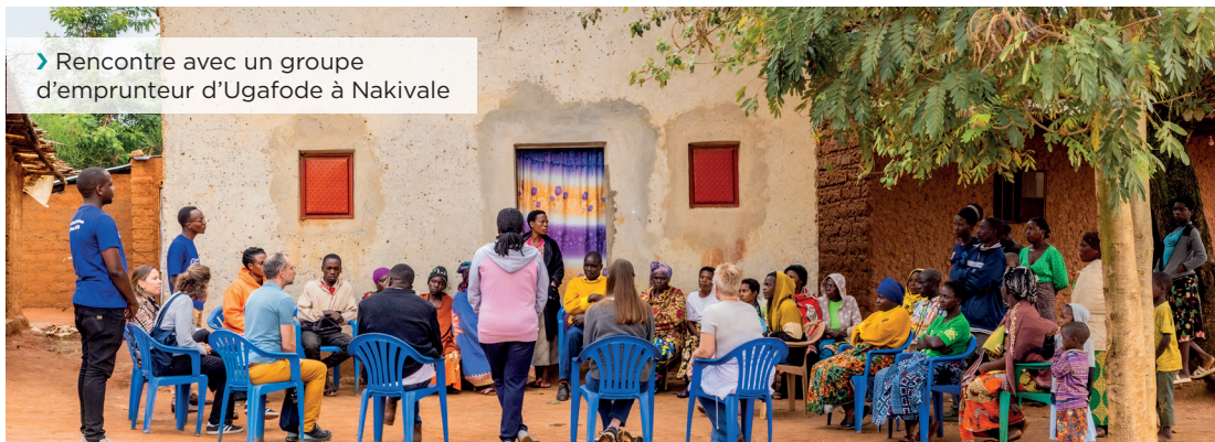
➤ Rencontre avec un groupe d'emprunteur d'Ugafode à Nakivale

Le modèle économique que ce projet espère mettre en place est un écosystème d'inclusion financière pour ce segment de marché mal desservi, dans lequel sont impliqués non seulement les partenaires humanitaires et les partenaires de projets à durée limitée du secteur de l'inclusion financière, mais aussi d'autres acteurs du secteur financier et des investisseurs du secteur privé, ce qui permettra d'inclure le marché des réfugiés dans l'écosystème mondial de l'inclusion financière, faisant ainsi pencher la balance vers le développement dans le nexus HDP (Humanitaire, Développement, Paix).