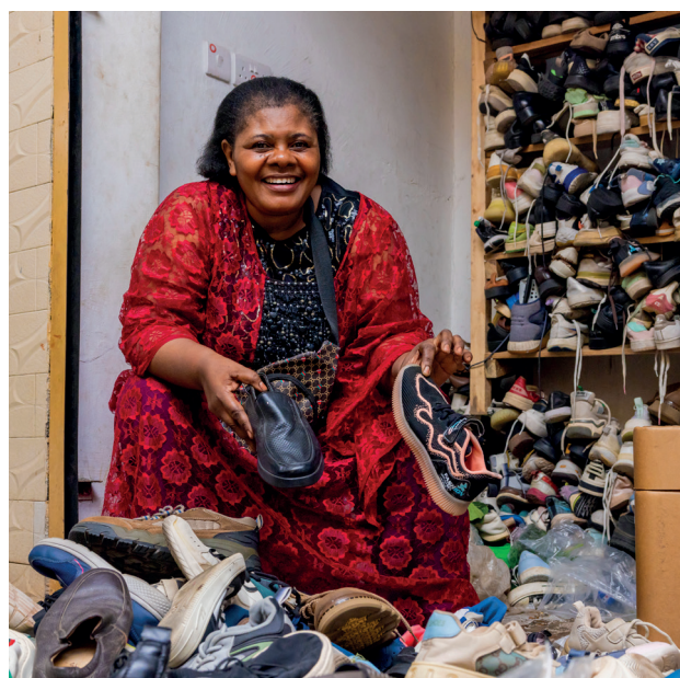
➤ Réfugiée de RDC à Kampala, cliente de VisionFund Uganda

En octobre 2025, les équipes de FGCA et de Proparco se sont rendues en Ouganda pour lancer officiellement cette nouvelle phase et rencontrer sur place les deux partenaires clés du programme : UGAFODE Microfinance Limited et Vision Fund Uganda (VFU) , qui ont déjà démontré leur efficacité dans le service aux réfugiés et aux communautés d'accueil en Ouganda lors du premier programme pilote mis en œuvre entre 2019 et 2023.